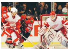
Zetterbergs succé i NHL fortsätter.

Chicagos rookies Patrick Kane och Jonathan Toews gjorde två av målen. TT