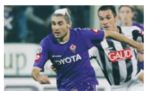
Fiorentinas Adrian Mutu är skadad.

han Rumäniens EM-kvalmatcher mot Bulgarien (17 september) och Albanien (21 september). Fiorentina ligger tvåa i Serie A efter tolv omgångar. Inter leder på 25 poäng med en match mindre spelad. TT